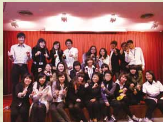
■大四論文發表會——手指比出象徵100級的100，也象徵我們合作100分