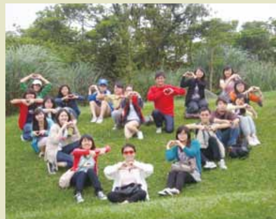
■班遊——陽明山一日遊，於草地上坐成愛心的形狀，象徵我們班的心