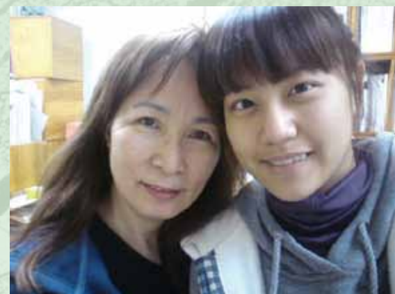
■老師年輕時候一定超美