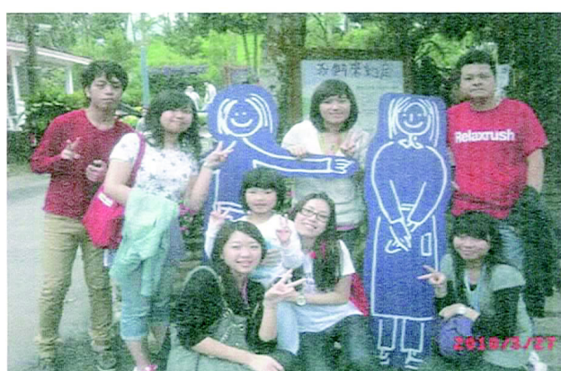
這是大家期待已久的目的地：薰衣草森林。