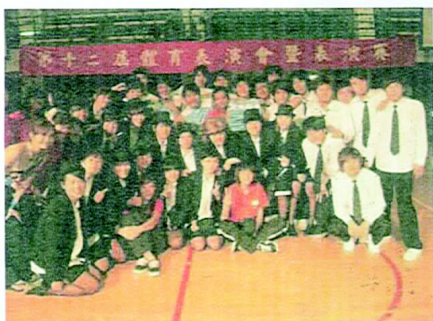
今年是第12屆的體育表演會，參與表演和幕後的成員眾多。

今年體育系一改往年的方式呈現表演，並且盡力解決所有的障礙，儘管少了非本校的學生一同參與，但是大家的用心仍是值得鼓勵的。