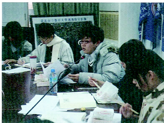
議長回覆委員的提議