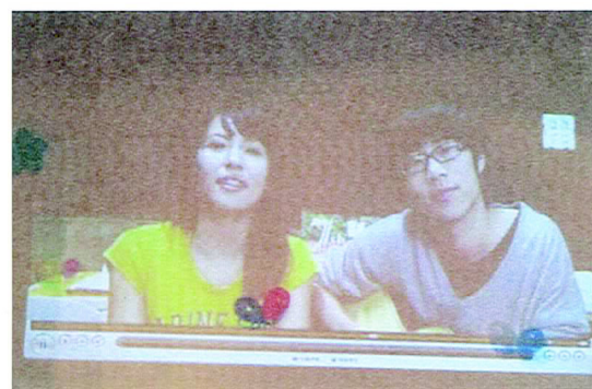
今年的創舉！賽前播放感言以緩和現場氣氛！