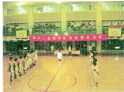
眾多好手都在場上，這是聚集校內高手的校隊和體育系的對決。