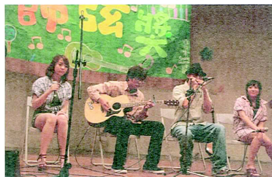
今年比賽中，有著最佳默契的團體！