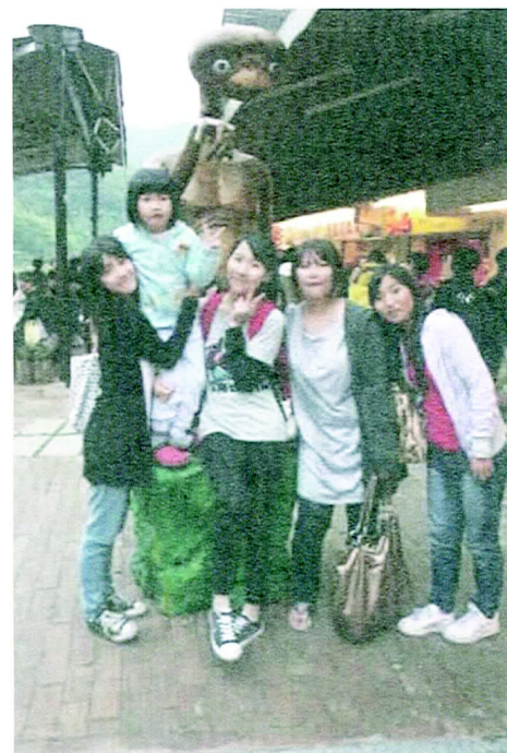
春遊的最後一站：內灣老街。

內灣老街人山人海，非常熱鬧，古早味的糖果店、賣炸地瓜和野薑花粽的小吃攤，整條街逛下來肚子也飽了。不知不覺太陽西下，是該結束春遊行程的時刻，僑生們不捨的搭上遊覽車回到台北。這段春遊行程走完，僑生們的關係似乎親近了很多，雖然只是短短的一天，這趟旅程卻創造了僑生們共同的美好回憶。