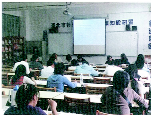
聽取學生會長報告蘋果節活動，並審查結算

既然被委任為議員，就應甘願花時間為民謀福，難道好處會比別人少嗎？如果與會者可以白白地領餐點，這裡應該稱做同樂會。既然稱之議會，便是在會議中專心討論；在散會後，吃著因公遲來的犒賞，才沒扭曲誤餐的本意。望議員自我覺醒，拿出更好的成績，要吃西堤，同學也甘心。