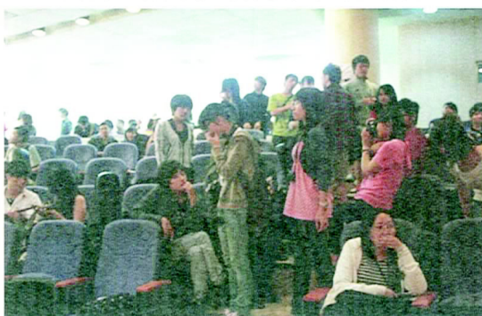
除了參賽者多，今年的觀眾也比往年多！