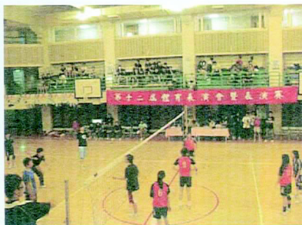
難得一見的男排vs女排同場對抗。