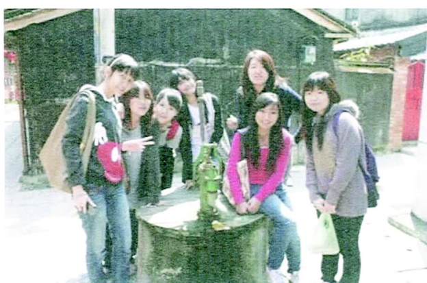
北埔老街裡面有好多古早味的東西。