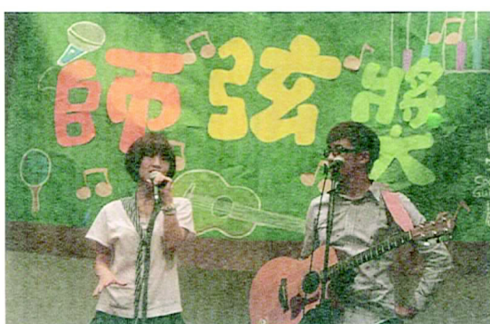
知名樂團—棉花糖是今年的表演嘉賓！