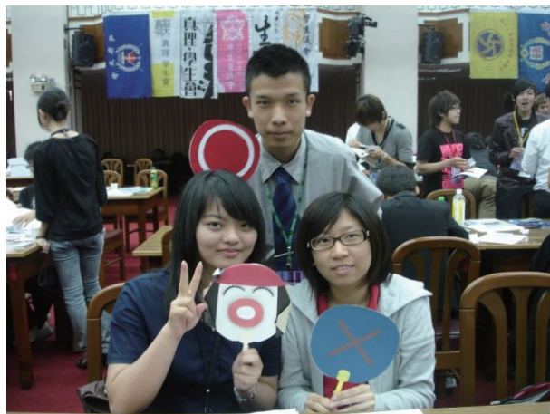
前會長（右）帶領新任正會長（左）、副會長（上）參加研習會，希望帶給同學更好的服務。

活動預告：校慶將釋出更多活動讓社團發揮，不只是邀請藝人唱唱跳跳，帶著大家High個幾分鐘就賺走幾萬塊，打算多安排社團表演。主軸會有「舞唱會」與公益樹（領養孤兒小朋友的希望，讓同學有為社會付出的經驗）等活動。