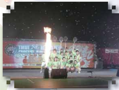
樂而網返的ending pose搭配火焰更是震撼人心！