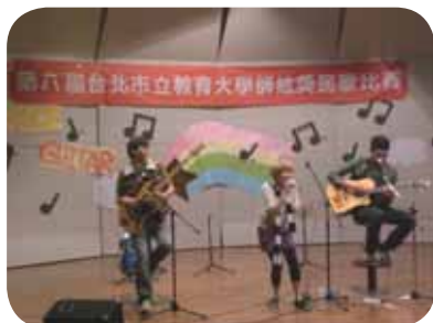
「美味星球」樂團為活動加碼演出！