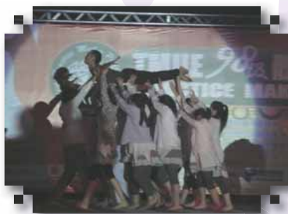
一片詭譎的氣氛中，杜鵑窩的狂想有了完美呈現！

今年的體表會將在震撼人心的鼓聲中劃下完美句點，「擂鼓鳴金」呈現出體育系滿滿的氣勢與自信，節拍整齊、強而有力、緊扣人心，不同特質的鼓，搭配擁有熟練技巧的擊鼓者，全場的節奏快慢及強烈氛圍，全部都在場上的表演者掌控之中，這樣的架式與默契，正是體表會的精隨所在！