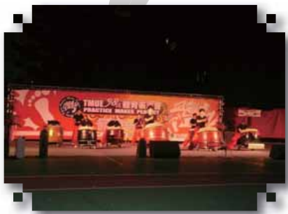
驚人的節奏感與整齊度使擂鼓鳴金更具吸引力！