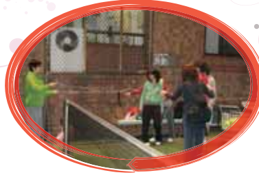
想著如何製造出手動式的網球網。