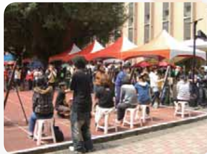
素描接力活動現場的氣氛熱鬧！

原定於創視祭第一天晚上舉辦的紙片名模生死鬥，因報名人數太少而取消，跟以往熱鬧的藝術節相差甚多。以往的藝術節，規定每個系都至少出一組或一隊，所以至少有十來隊以上參加，加上來加油打氣的親友團們，常使得空盪盪的中正堂爆滿！以前場面的浩大，跟今年的乏人問津真是很大的對比，不僅是這個活動，今年創視祭的其他活動，跟往年藝術節也有很大的不同，最大的原因就是經費的短缺，以前的藝術節大都有十來萬的補助，今年卻只有大約三萬的補助，能辦得成功全仰賴全視藝系同學的努力！雖然少了財力的支持，無法像之前還請專業的相聲表演，且幾乎全部的場佈都是靠視藝系的師生搭起來的，但也讓整個視藝系更加團結，相信即使遇到逆境，視藝系還是可以打造一個盛大的藝術節！