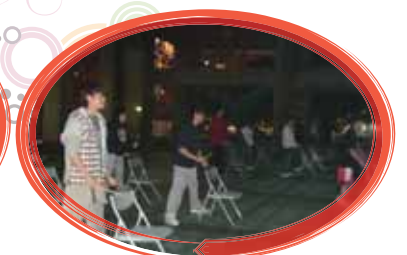
在夜晚還是努力的練習，辛苦了！