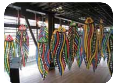
裝飾鮮豔美麗的走廊！