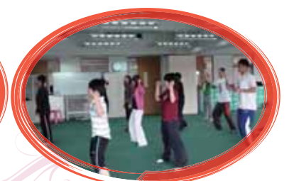
不斷練習動作，展現力與美！