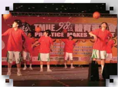
帥氣的拋接動作是籃兒當自強的重頭戲之一！