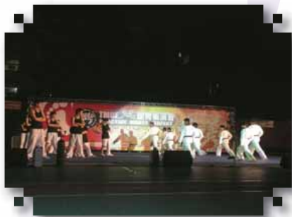
為了一袋米，舞抬瘋瞬間引爆街舞與跆拳道對決！