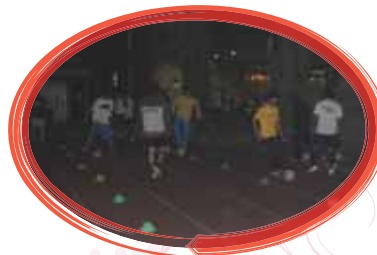
為了練足球而辛苦練習走位。

體表會結束了，從第一次排演後的大幅修改，到彩排以及正式演出，能將這些辛苦的成果完整呈現給觀眾，真的是相當令人感動！即使體表會已經結束，相信練習中的點點滴滴一定會成為參與人員一生難忘的回憶。Practice Makes Perfect，體表會的成果是從無到有的累積，象徵著很多事並不是不會，而是沒有去練習，凡事只要不斷練習不斷思考，一定會達到你想完成的事情！