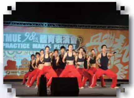
氧氣十足展現出來的力與美驚艷全場！