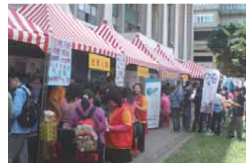
會場上人山人海，充滿了欲求職的人潮。

為了讓學生與產業界有所接觸，學校提供這樣的徵才活動，讓即將畢業的學生為將來進入社會職場做好準備，畢竟，在高失業率的現在，多一份機會，未來就多一份保障。