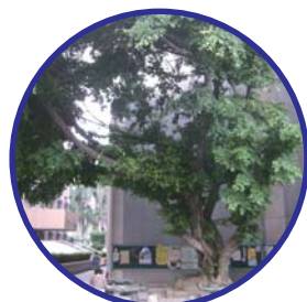
榕樹下是最佳的集合地點，也是學校珍貴的資產之一。