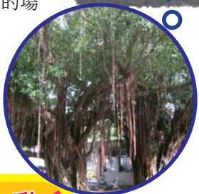
校門旁的母女榕，歷史也相當悠久，同時也是學校珍貴的資產之一。