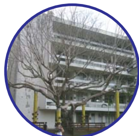
歷經無數個寒冬與炎夏，見證學校百年歷史的菩提老樹，陪伴我們共同成長。