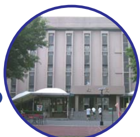
地餐和宿舍，都有我們共同的足跡。