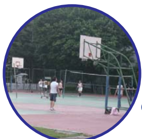
在操場上和朋友們一起練球，盡情揮灑汗水，是件很棒的事！