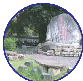
圖書館前的小庭院，可以讓學生進行討論，也可以當作短暫休憩的場所。