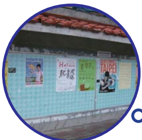
從公告欄上可以獲得許多講座和活動資訊，充實我們的生活。