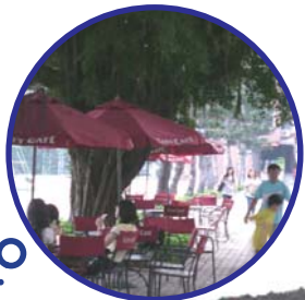
和朋友們相聚片刻，體會悠閒愜意的感覺。