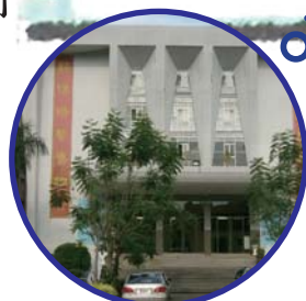
舉辦大型活動的禮堂，也是進行運動和比賽的好場所。