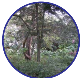
自科館前的生態植物園，裡頭有許多豐富的樹種，是個研究的寶庫。