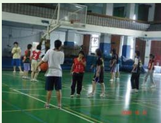
比賽選手們使出渾身解數，以爭奪冠軍榮耀！

今年的新生盃到此告一個段落，而下學期則會有系際杯及木鐸杯，屆時也希望比賽的選手都能爭取到理想的名次，而觀眾們也別忘了去看看比賽，為在場上揮灑汗水的選手們加油！