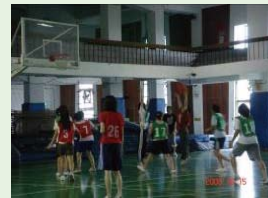
籃球比賽的現場狀況