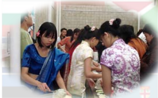
辛苦的工作人員正忙著張羅美食

若對本期月刊內容有疑問，或對下期月刊內容有指教，請來信青年社信箱 seiga000@yahoo.com.tw ，或直接上青年社無名網誌： http://www.urech.cc/blog/seiga000 給予我們您寶貴的意見。