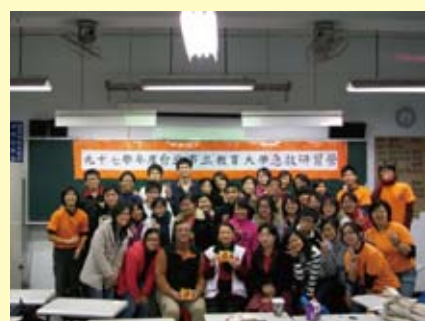
學員與教練及全體工作人員合影

承辦此次急救營活動的嚕啦啦社表示，舉辦急救訓練營的目的除了能夠讓本校學生多一個獲取證照的機會外，更重要的是希望本校的學生能夠具備基本的急救常識與技能，以備不時之需。另外，嚕啦啦也表示，這次活動宣傳成效不彰，以至於實際參加人數與當初預估有明顯的落差，因此在宣傳方面會檢討改善。此外，在活動的流程方面也沒有向參加的學員交代清楚，學員在活動當天才知道整個活動的內容，關於這個問題，嚕啦啦也承諾會改進，等內部商討過後會想出合適的辦法解決這樣的問題。這次活動雖然有些微小疏失，但整體而言還算不錯，對於承辦活動的工作人員與指導教練們所付出的辛勞，學員們也都給於高度的肯定，期望在檢討改進後，下次的活動能夠更加圓滿順利。