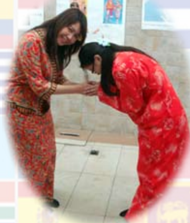
馬來西亞傳統服飾及打招呼的方式