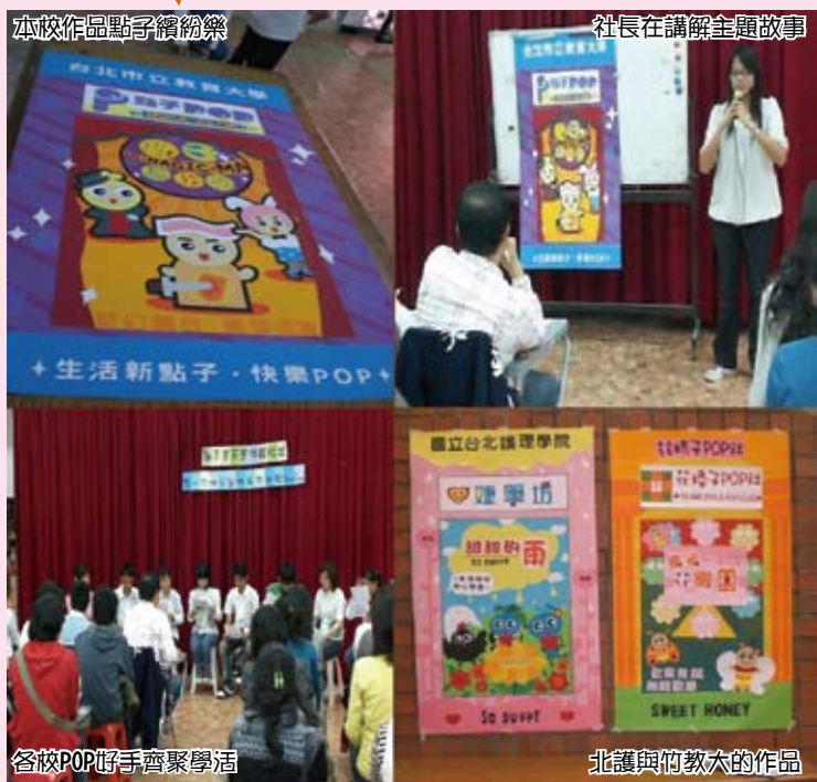
本校作品點子繽紛樂