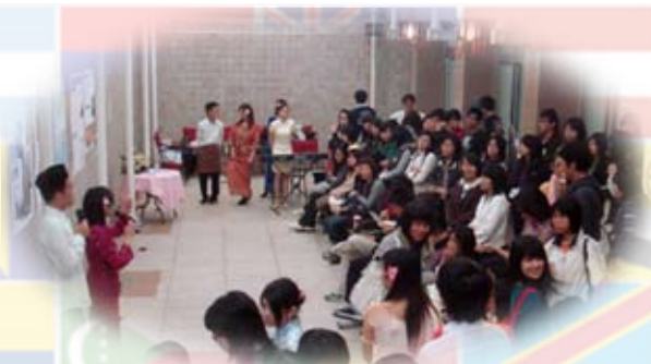
活動現場人山人海

第二天，主辦單位特別準備了第一天介紹過的馬來西亞特色小吃，邀請現場觀眾們實地品嚐，體會一下道地馬來西亞風味的美食，不過據現場工作人員透露，這次準備的料理為了配合一般台灣人的口味，已經降低為最低辣度，若還是無法接受這樣的辣度，那麼你可能無法招架馬來西亞當地的「真口味」囉！