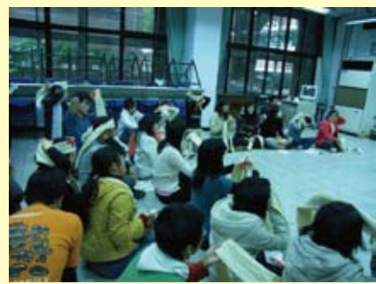
參加急救訓練營的學員們認真練習包紮