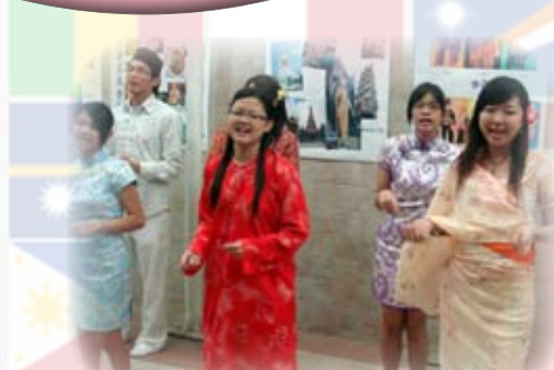
表演者們賣力的演出