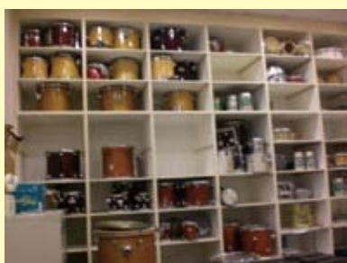
架上陳列著各式各樣的鼓，令人大開眼界！

為了推廣打擊樂，在1989以及1992分別成立了「財團法人擊樂文教基金會」與「朱宗慶打擊樂教學系統」來處理音樂行政、推廣工作以及打擊樂人才的培訓等，希望能夠達到長期推廣的效果，而非曇花一現。就如同創辦人朱宗慶的名言：只要有心跳的人就可以打擊並聆聽打擊樂！他們不畏艱難，勇敢築夢的精神，相當值得我們效法，在經濟不景氣的現代，我們必須秉持恆心，涉獵多元的領域，並為未來做長遠、有組織的規劃，才能像朱宗慶打擊樂團一樣，嶄露頭角！