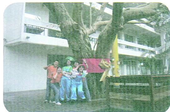
↑大家一起來歡慶老樹生日

這次活動的時間雖然不長，但卻蘊含著相當深刻的涵義，除了響應環保、為整個生態環境盡一份心力外，更重要的是將傳承與敬老的精神，植入所有全校師生的心中。