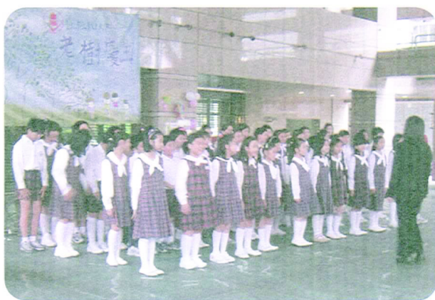
↑市教大附小的小天使們為老樹們高聲歡唱

樹苗植入本校校園中，象徵薪火相傳，生命永續不絕。而在此之後由民俗體育社所帶來的精采表演，更博得滿堂的掌聲和喝采，也為整場活動更添歡樂氣息。回身、旋轉，在拋與接中象徵老樹們所經歷的風風雨雨，在大起大落中仍能昂然挺立直到今天，而在表演的過程中，雖然表演者偶有失誤，但最重要的是那股無所畏懼、勇於堅持到底的決心，如同老樹們無論遇到怎樣的困境，都能以無比的勇氣和毅力去面對，這樣的精神，成為所有全校師生最佳的典範。活動的最後，在由管樂社演奏的動人樂曲聲中，劃下完美的句點。