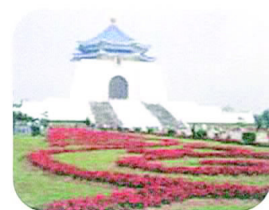
□ 中正紀念堂被悉心照顧的草地種滿令人賞心悅目的花草

西門町商圈：約步行 15 分鐘，就能到大家熟悉的西門町，每到下班時間或假日，就會有滿滿的人潮，裡面從吃的、穿的到玩的都一應俱全，如果想看電影的可以到電影街，一整條街都是電影院，任君挑選；除此之外，也有制服街、3C 街……等，貨比三家，不吃虧唷！