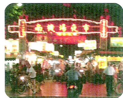
□ 熱鬧的南機場夜市是學生逛街的好去處。

至於喜歡吃海鮮的同學，你可以考慮地點位於南昌夜市，雖然規模不大，但這裡也是有許多飲食攤販，其中又以海產現炒攤位居多，當然也有其他的小吃，像臭豆腐、四神湯……等。