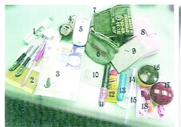
□ 琳瑯滿目的文具總是讓人看得目不暇給

除了上述所推薦之外，學校附近的某些文具店家也常常趁著開學的旺季拋售多樣的產品，學生族想要撿便宜的話，可以在學校附近多走走逛逛，或是多打聽多比較，搞不好也能有不錯的收穫囉！