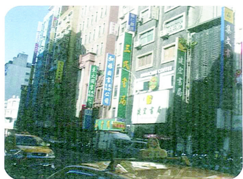
□ 重慶南路上市店林立

此外，金石堂和墊腳石除了販售各類書籍和雜誌外，也售有文具、卡片、禮品、筆記本等商品，為一綜合型的圖書文具廣場；而如果想自學電腦，或想對電腦相關問題有更深層的了解，不妨到天瓏專業電腦書局走一趟，說不定會有意外的收穫哦！