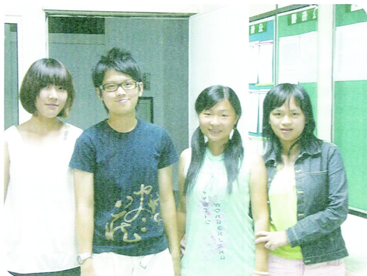
□ 採訪後與會長（左二）合照

至於學生會本身，其實很多學校的學生會式微狀況不斷在惡化中，本校也面臨了相似問題，不僅是大部分的同學沒有參與學生會的意願，也包括同學對學生會的不信任感，事實上這也可能因為學生會與校方溝通的內容並未透明化的關係，使得同學往往不知道學生會與校方所做的溝通與努力，對於這部份，會長擬定與青年社合作，將與處室會談的會議紀錄定期發刊，給同學管道能更認識學生會。在訪談的最後，會長也對往後的一年做了初步規劃，她希望能參考傳統的活動及作法並且融入創新的巧思來舉辦活動，如校慶週、招生展，希望能夠吸取前人經驗，創造更美好的臺北市立教育大學。