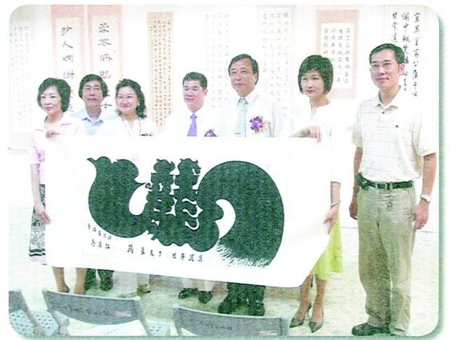
□ 長官們前來參與後的合照

尤其是以人文氣息素質為重的書法藝術，在今強調科技發展的時代中，更值得去珍惜和學習，本活動以鼓勵書法風氣，重視以人文為首要的書法創作，具有正面推廣文化教育之意義。在活動過程中，邀請所有北區大專院校有興趣的學生一同參與，以彰顯書法教育之落實與學習之風尚，展現學生樂觀進取又富有人文素質之風貌。