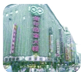
□ 車水馬龍熱鬧的西門町商圈