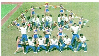
社教系的拱橋十分漂亮

身穿藍白的啦啦隊服，呼喊著口號進場。大動作的舞蹈與臉上的笑容相互輝映著。第一段最後上層的人手牽起來搭成一座拱橋，更是令大家眼睛為之一亮，再加上前方的特技，整體畫面看起來很漂亮。之後還有用人直接在地面上排出社教系的英文「SOCIAL」也很有創意。第二段輕鬆的動作配合嬉皮的音樂，手勾著手轉圈圈跳著社交舞，表現出愉悅的心情。再加上之後的土風舞，手牽手圍成兩個同心圓，讓人感覺十分親切。還有用彩球排成歡呼的波浪，也讓大家充分感受到那種熱情。