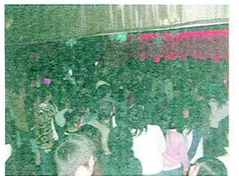
↑ 舞會現場一景，人山人海的觀眾，擠的水洩不通啊!

整個活動下來，有不少同學向教育系系學會表示這大概是她們上大學以來所參與一場最像大學活動的活動，也有工作人員表示這是他上大學後的一大挑戰與突破!而總召則表示：為了這次的舞會，所有工作人員都投下了不少心力，也佔據了很多私人時間。但是也因此讓他學會如何與夥伴溝通，遇到問題(像是場地協調、餐點問題等)該如何有效率的解決。能看到整場活動圓滿落幕，現場大爆滿(共650人)又人人都很開心的狀態，就是讓工作人員最開心的一幕了!期待著明年能繼續有如此好玩又便宜的舞會，邀請全校同學一起來狂歡!