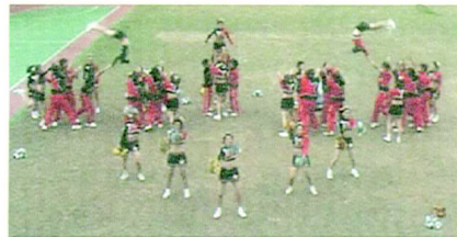
拋接的競技，令觀眾拍手叫好！

以熱情的歡呼進場，穿著紅色跟黑色的啦啦隊服。『GO! GO! EAGLES! WE ARE NUMBER ONE!』勁爆的音樂，開頭就包含了許多競技，有抬腿還有把flyer在空中轉身。乾淨俐落的動作，「喝！」充滿力道的一踢。扎實的動作，舞蹈一層層的層次做到非常完美。神采飛揚的公共學系，『EVERYBODY SAY GOLD AND WHITE!』充滿自信而且簡潔有力的口號，帶動起全場熱絡氣氛。第二段開始，上層互相肩搭著肩跳起康康舞。跟音教系不同的是，公共系他們是flyer，難度也比較高。菱形的隊伍不停的垂直旋轉，但是依然整齊劃一。還有組與組之間的拋接，讓大家為他們拍手喝采。再配合音效，把人彈起來，畫面更是有趣。