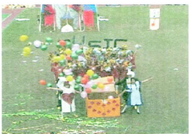
市北教大生日快樂，音教99愛你99！

以童話故事愛麗絲夢遊仙境為背景，當愛麗絲遇到了撲克牌士兵。金色的鞋子配合著撲克牌特別的穿著，令在場觀眾無不耳目一新。藉由前面跟背後不同圖案，轉身來做到翻牌的效果；直排旋轉配合著音樂就像指針一般。尤其是當黑桃跟紅心A到K翻牌的時候，看起來整齊劃一。第二段則像紅磨坊，免耳跟亮紅色的衣服、裙子還有熱情的音樂帶來的舞蹈。舞者手勾起手，跳起康康舞，炒熱了現場的氣氛。之後愛麗絲就像遊花園一樣，一組一組的觀看者。最後更提出了一盒大禮物要送給學校。裡面裝著許多氣球，一邊打開讓氣球迎風飛揚；一邊唱生日快樂歌，在這天來為學校慶生。