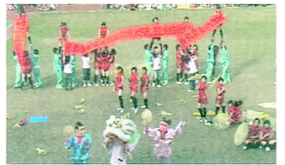
幼教系祝市教大生日快樂

開場點燃了爆竹，以舞獅貫穿整場表演。身著一襲古裝的幼教系，引領的鼓聲揭開了表演的序幕。「喝！」的一聲『男兒當自強』雄厚的音樂，隨著強而有力的一拳。『傲氣面對萬重浪，熱血像那紅日光。膽似鐵打，骨如精鋼...』英雄豪氣的氣勢，令在場的觀眾無不攝服。「幼教英雄到來！」脫下馬褂，大紅大藍的衣服遜麗奪目令大家感到驚喜。熱情洋溢的舞蹈跟動感的手姿，還有街舞跟地板動作，在場觀眾無一不被感染。輻射狀的隊形搭配後方的競技，還有拔腿場面則是好看。用「財神到」音樂配合舞獅，還有手中的黃色紙傘旋轉著，把過節的氣氛表現的淋漓盡致。最後flyer拿出對聯，恭祝市教大生日快樂，劃下完美的句點。