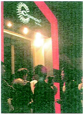
↑ 舞會的入口一景，排著許多等待入場的人們!