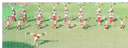
面帶笑容自信活潑的心語

開場柔美的音樂，配合的白色翅膀的天使翩翩起舞。優美的旋律跟美妙的舞姿，都讓人心靈感到無比清新。輕盈的跳躍著，每一個步伐就像飛了起來。活潑的米奇音樂還有朝氣的舞蹈，帶動起現場觀眾的心。充滿自信的演出，讓人感受到他們的青春洋溢。音樂再度轉換，場景回到白色翅膀跟黑色翅膀的天使祈禱著進場。看著他們手牽著手，踏著輕柔的舞步，時而圍成圈；時而在場上穿梭飛舞，黑與白的交織，心靈也彷彿再度感到平靜。之後的彩球波浪、四個散布四方的小十字隊形，還有隊伍排列也有著美感。