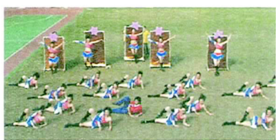
撩人的表演，全場無不驚艷！

充滿神秘感的黑色披風，當脫下神秘面紗的那一刻畫面無不令人驚嘆。讓人驚喜的開頭獨秀配合奇幻的音樂，熱情的舞蹈，使得現場尖叫連連。撩人的姿勢展現出獨特的熱情，尤其是大聲呼喊著口號時，配合著起身站立來排出「TMUE」的字樣非常的好看。第二段更是讓人驚艷，站在鏡子前背對前方，在激情的音樂一邊搔首弄姿，立刻牢牢的吸住所有人的目光。性感的動作、扭腰擺臀，看得臉紅心跳。連續的跳馬背跟翻跟斗，在場驚喜聲四起。從橫排電梯轉到直排，加上把上層躺平排成十字型，隊型變換充滿創意。英教系的熱舞，舉手投足間，每一個動作都讓在場的觀眾印象深刻。