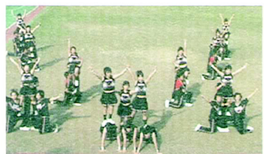
體育系活力萬射的展現

手握黃色大旗身、穿黑色的啦啦隊服進場的，這就是體育學系。與其他人不同，他們所展現出的是充滿活力的PARAPARA。強而有力的音樂配合著飛揚的旗海，令人賞心悅目。簡潔有力的動作，一大片黃色的波浪就在操場上翻騰。迎接著女生表演的扇子舞，當扇子像花一般的綻放，一面波動一面旋轉，畫面十分漂亮。活潑音樂配合靈活的手姿，PARAPARA的魅力就在他們的自信與熱情下，散發出萬丈光芒，照亮了大地。就如同響徹雲霄的口號一樣，體育系擁有滿滿的力量與朝氣帶給人們無比的勇氣。快速的移動後拋，看著他們在場上跑跳著，如此精采的演出真讓人躍躍欲試阿。