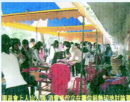
園遊會上人山人海，消費者佇立在攤位前熱切地討論著

【教育系朱韻蓀撰稿】本校在十二月二十二日歡度一百一十一週年校慶，藉由點燃一百一十一柱聖火揭開活動序幕。首先登場的是由各系吉祥物所帶來的精采表演，那逗趣的表情、可愛的模樣，一出場立即獲得現場嘉賓如雷的掌聲！而教育系三年級體育組和體育系二年級同學所帶來的國術表演，更是充分展現了「力與美」的結合，磅礴的氣勢、行雲流水的動作，把國術的力與美展現得淋漓盡致，讓人看得如醉如痴。而今年的啦啦隊冠軍—教育系，也帶來了精采的表演。以「嫁娶」為主題，融合了古典和現代，柔情中又表現了剛強，喜洋洋的氣氛更是為校慶增添了一絲恭賀的氣息。