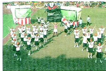
自科系活潑動人的熱舞

「噹噹噹！」的打鐘聲，自科一班上課了。『立正站好看這裡，太緊張的先稍息。英雄馬上就要出現，最刁一尤的人得第一...』活潑的音樂、可愛的舞蹈，都讓在場觀眾覺得十分動心。戴著橘色圓帽、背著書包、身穿制服的學生跟著黑色蕾絲裙老師，還有非常勁爆的林老師，給場邊的群眾來帶不少快樂的氣息。第二段也使用了卡通音樂，『我們是正義的一方，要和惡勢力來對抗。有智慧，有膽量，越戰越堅強...』此時背景也跟著架設了一隻無敵鐵金剛。他的手還會噴乾冰，現場更是驚訝聲的不斷。最後的打鐘聲象徵自科一班下課了，『老師再見！小朋友再見！大家明天見再見！』如此逗趣的表演，讓大家對他們給予最熱烈的掌聲。