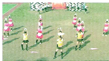
舞孃性感的舞姿，全場為之瘋狂！

以宮殿城堡為佈景，活潑的動作搭配手中的傘來跳舞。簡單的舞蹈、逗趣的姿勢既清新又有趣。第二段張開的傘配合哆啦A夢的出場，可愛的舞蹈配合著一個個藍色粉紅色的傘旋轉著，場面則是好看。之後圍成一個大圈揮舞著傘更是讓人感到夢幻。音樂也有許多元素，有嘻哈的熱舞，不管是節奏或是重拍都讓人沸騰。有蔡依林的舞孃，撩人的姿勢立刻吸引大家的目光。性感的舞姿，一舉一動都令在場的觀眾為他們歡呼。最後也有大琢愛的HAPPY DAY，希望今天是快樂的一天。輕快的舞步展現出的活力，還有臉上愉悅的笑容完全把歡樂的氣氛散發出來，感染了在場每一位觀眾。