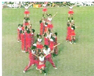
競技為主，熱情奔放的數資系。

一身橘紅色的衣服，展現朝氣蓬勃的型態，這就是數資系。充滿爆點的音樂，名副其實的競技啦啦隊，開頭的競技就讓人感到驚喜。看著上層的flyer不斷的上升下降，形成漂亮的視覺效果，讓在場群眾替他們極力讚揚。整齊劃一的舞步搭配簡潔的手姿，展現出揮灑自己的青春。象徵TIGERS的數資，不論是口號的精神呼喊還是隊伍的舞蹈，都充分讓大家感到那股熱忱。賣力的表演，在電梯的情況下一直變化隊形，搭配難度的競技表現。不管是延伸還是其他金字塔都表現的十分出色。