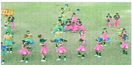
中語系充滿朝氣的演出

身穿灰色的布，由祭司領導進場。抬著祭品就像進行著神秘的儀式。中語系的表演可以分成了許多部分，包含了數個元素。先是由輕快的鼓聲搭配著扇子舞，就像傳統日本常用的節日慶祝方式。舞者不停的跳動著，每當扇子「啪！」的一聲打開就如同伴隨著驚奇。接著是緞帶舞，身體性感的搖動。隨著音樂，一舉一動充滿了熱情。第三部份則是大旗的展現，手一揮動，八字形的轉著，一片片金黃色的旗子就在操場上飛揚。最後再帶到彩球的部份。直排時，藉由手臂張開的弧度不同，正面看起來像千手觀音一般充滿美感。音樂方面則是大量使用了電音，搖動彩球搭配舞蹈，展現亮麗的演出。