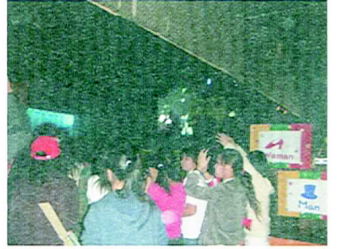
↑ 現場超HIGH氣氛，觀眾們看表演的目不轉睛!DJ也很HIGH喔!