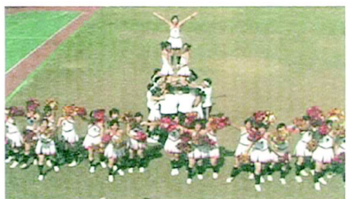
2.5段三層高難度的競技

活潑逗趣的瑪莉歐開頭就讓大家充滿驚喜。以瑪莉歐為主軸，搭配著音樂，不管是瑪莉歐吃蘑菇、撞方塊拿金幣就帶來不少歡笑聲。身體隨著搖滾的音樂擺動著，特教系的表演裡，不僅有熱情的舞蹈也有精采的競技。一開場的延伸還有三個由前到後的拋人的動作造成視覺效果，就讓群眾感到驚嘆。之後的reload跟抬腿也很完美。這時候前方一排拿起彩球隨著波浪擺動，音樂再度回到瑪莉歐追逐蘑菇，此時後排將flyer前倒後拋就像不倒翁一樣擺動。在節奏逐漸加快的音樂重拍下，最後更是以高難度的競技做結束。2.5段三層two-tow-one向高度的挑戰，令在場的各位都為他們精湛的演出而大聲歡呼。