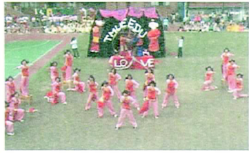
『夫妻交拜，送入洞房！』

所展現的主題是「嫁娶」，以創校的那一年呼應校慶。用古代中國的婚禮的形式，藉由啦啦隊鼓舞士氣的精神，把婚禮中濃厚的喜氣散發給各位觀眾。服裝跟開場的舞蹈就讓觀眾為之興奮。古代跟現代音樂的結合恰到好處，更是搭配了台語歌『小姐，妳請妳給我愛。先生，我歹勢在心內。有你在身邊，我的心就充滿了愛的光彩...』以媒婆跟拜堂還有弄璋之喜的劇情，一幕幕都讓人目不轉睛。迎娶的時候，還有花轎等許多道具，都看得出教育系的用心。不單單是隊形變換的漂亮，一段段充滿活力的熱舞，使得整場表演熱鬧非凡。十分緊湊的節奏，現場高潮不斷。最後更以團拍作為結束，所釋放出來的歡樂氣氛在場無不感同身受！