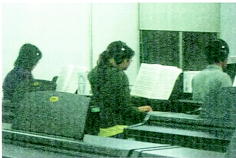
←新開放的305電子琴房

而音樂系的歐主任則表示，會關閉五樓的外系琴房，是由多方面去考量而得到的決定，其中，最重要的就是安全性上的考量。根據音樂系系主任的說法，之前的琴房由於24小時開放，且無人管理，若有外校不明人士混入，怕