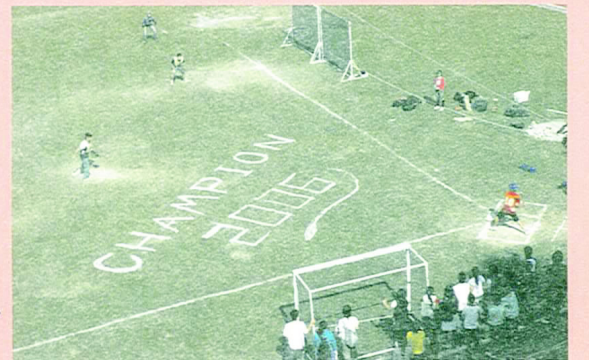
令人緊張的體育系對美一教系的冠軍戰開打了

壘 球：壘球是大部分的同學比較少接觸的一項運動，大家規則可能比較不熟。壘球演進自棒球，而投球是用低手投法。其中擊球跑壘員上壘後不可離壘，也不可盜壘。新生盃系列賽，一開始先是10月30日的開幕戰，由美教系以6比3自科系。之後11月1號的比賽中，雖然天候不佳，但是啦啦隊的熱情依然不減，賣力的替場上的選手加油。結果是幼教系以7比8敗給了社教與公共系。在11月2號，數資系以13比2強力的壓制下贏了教育系；然而體育系也不讓人專美於前，就在隔天發揮強力的打擊，以21比3擊退了特教系。而11月6號中語系在對數資系的比賽，先是一路追趕，但是他們堅持到最後一刻，最後以5比3逆轉了比賽。美教對社教與公共的比賽更是互相你爭我奪。先是社公在一局下先拿到四分；而美教在二局上也立刻以四分回敬。第三局更是各拿下兩分，雙方互不相讓一直到五局下還是9比9平手。最後美教在下一半局再拿下一分，讓社教與公共系飲恨。11月8號體育系又在度展現驚人的攻擊能力，以15比1對中語，拿下決賽門票。就在隔天令人矚目的焦點，體育系對美教系的冠軍戰中，體育系依然發揮打擊所長，配合著優秀的守備能力，更有著雙殺的演出。最後體育系以19比3拿下冠軍；而美教系則是亞軍。