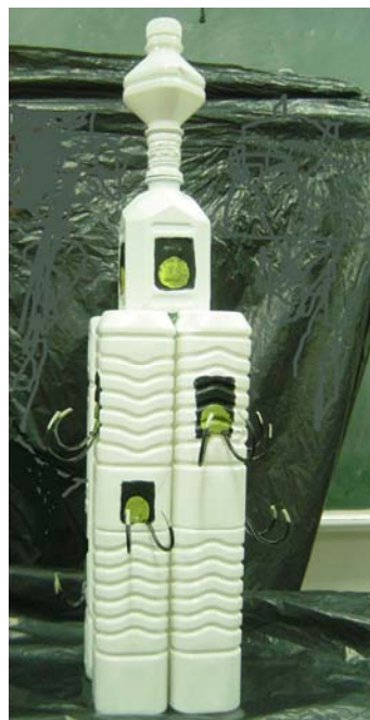
圖3 小組主題：白色巨塔— 掛鈎設計