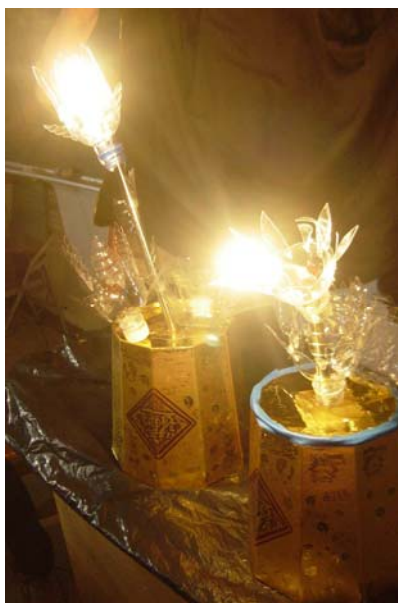
圖2 小組主題：招財進寶花開富貴— 夜燈設計

各組展開腦力激盪互相討論時，總會聽到、看到從不同角落所傳來的歡樂聲與專注的和諧氣氛，讓人產生莫大的欣慰。然而也有少部份學生抱怨”巧奪天工拼創意”的主題，攜帶的材料、用具蠻多，且在製作過程中很容易割傷手，以後不要再有類似的主題出現。但基本上，學生還蠻認同這樣的教學方式。