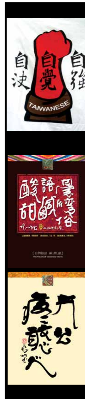
圖17 「TAIWANESE自強自覺自決」的創意T恤，結合圖像與中英文字造型美的組合設計，鮮明具體的傳達出社會運動者的理念訴求，也是漢字書藝美學的另類應用。