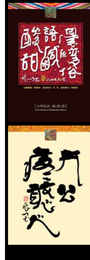
圖18 《台灣俗語鹹酸甜》的封面與卡片作品，是筆者2007年研發設計的書藝出版品。作品中的語詞，皆引自台灣俗語，書卡背面並附中英文註解，是結合台灣文學與書藝美學的國際文化交流創意產品。