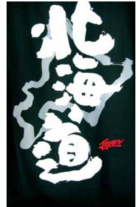
圖12 北海道T恤圖案，是2008年筆者旅遊所攝，足以見證日本的書道文化融入生活與觀光產業的普及化。

本次《無中生有》特展的策展理念強調：英文展名X beyond O，以O指涉文字的根源和書法的初衷，以X表徵未知的成果以及無限可能，董氏書法正如十根試管中的胚種，因為與參展藝術家個人秘煉的培養液遇合，而產生了不同的花果。