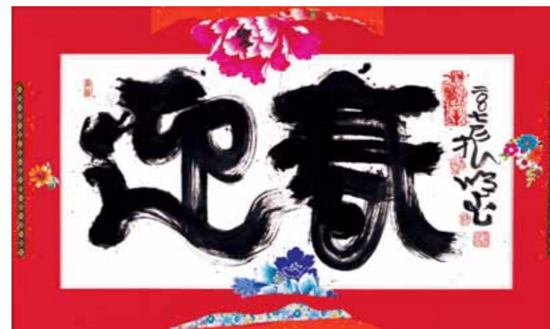
圖19 《迎春》是筆者2007年的書藝作品。「迎春」二字，中文語意是「迎接新春」；台文語意是「期待有餘」。此作語詞本土化，筆跡呈現台灣人率真性格，並將台灣花布的視覺喜氣應用於裝裱設計，個人自覺是頗具實驗性的台灣書藝作品。