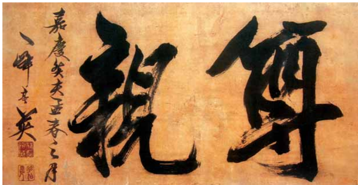
圖16 《尊親》林朝英 行書 67.2×132.7cm（引自文建會《明清時代台灣書畫作品》） 清代台南書畫家林朝英的書畫筆法中鋒與側鋒兼用，取義於風掃竹葉的飄盪力度，線條率真、豪邁有力。林氏作品不僅具個人風格，同時也是台灣書畫有別於中國文人書畫的顯例。

筆者認為，特展主題中的「O」意指：書法若做為視覺藝術的展品，其「內創性」的基本必備元素何在？「X」又指示：書法若做為跨界藝術的媒介，其「外應性」的發展原則何在？