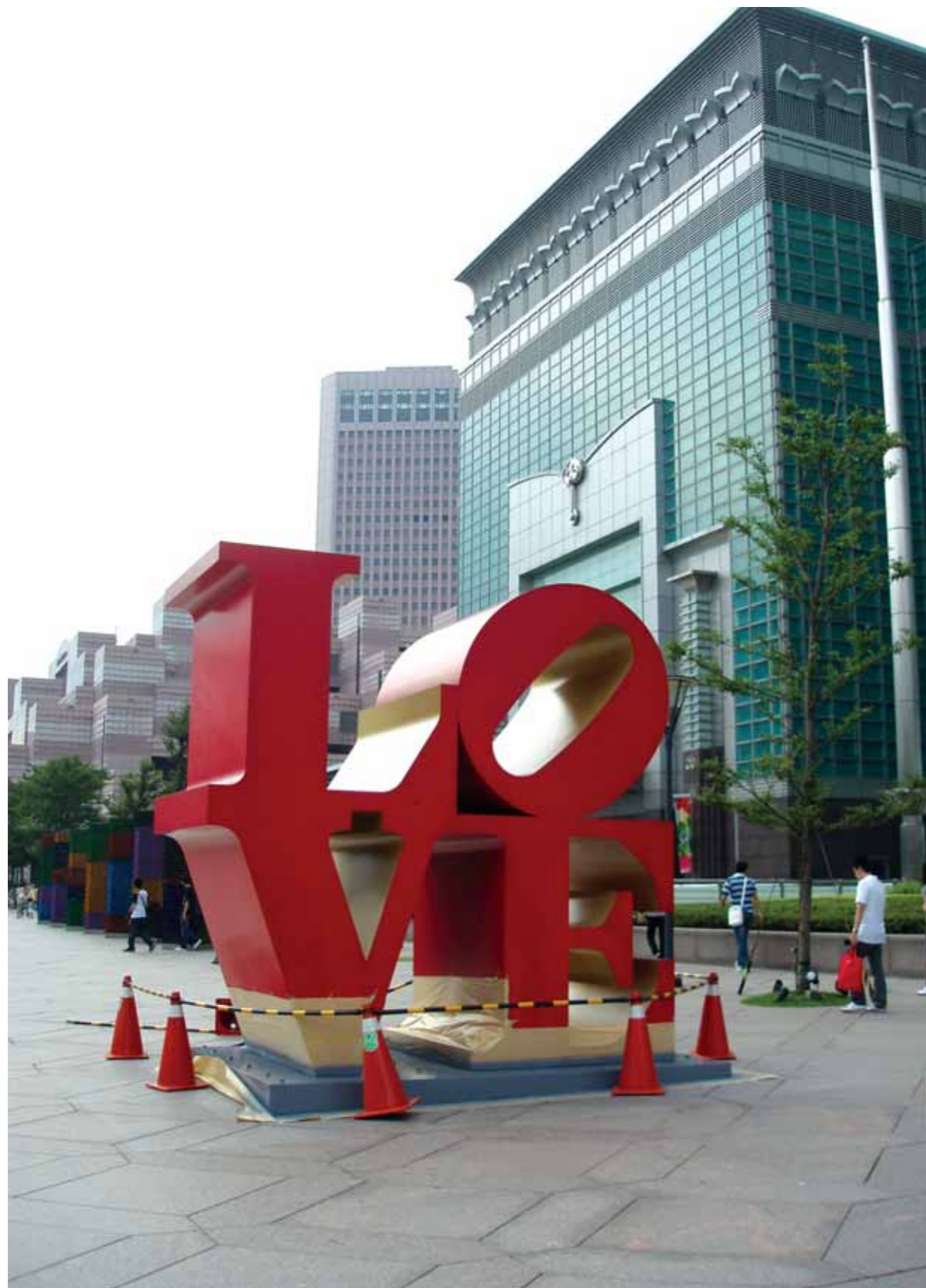
圖20 透過英文字母的拆解與重組造型理念的設計應用，將平面文字立體化，將文字內涵普世價值化，美國普普藝術大師羅伯特印地安那（Robert Indiana）著名的雕塑「LOVE」，成為台北信義計畫區公共藝術的新地景，普普大師羅伯特的創作理念或可引為台灣書藝立體化創作的參考。