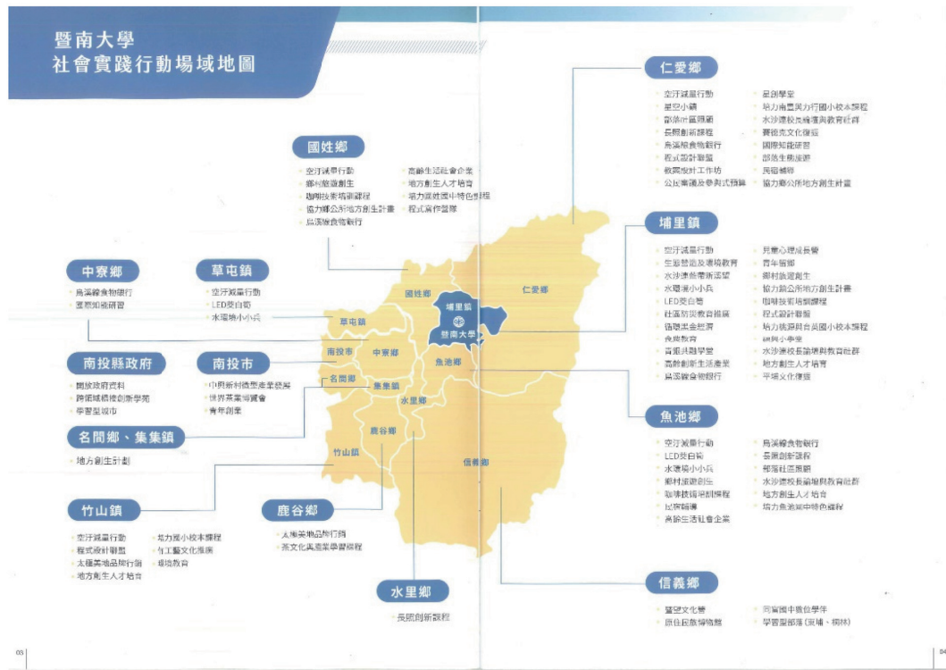
圖 2 國立暨南國際大學社會實踐行動場域地圖