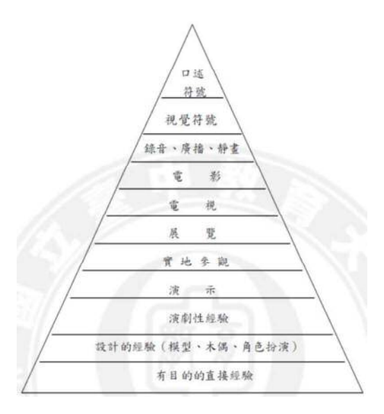
圖一 Dale 的經驗塔理論 (蔡宏仁, 2010)

經驗塔的排列方式與學習者的年齡有關係,年齡越小越需要直接的經驗,而隨著年齡的增加,學生較容易由上層的經驗獲得知識 (蔡宏仁,2010)。由上述可知,經驗塔中的實地參觀,指的其實就是戶外教學,教師如果能在學生學習中辦理戶外教學,相信可以為學生帶來感官上的學習經驗。